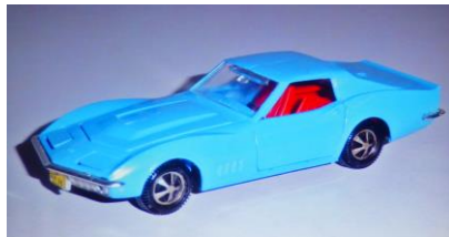
Original und Modell

..... oder eine schöne Corvette Stingray C3, 1974